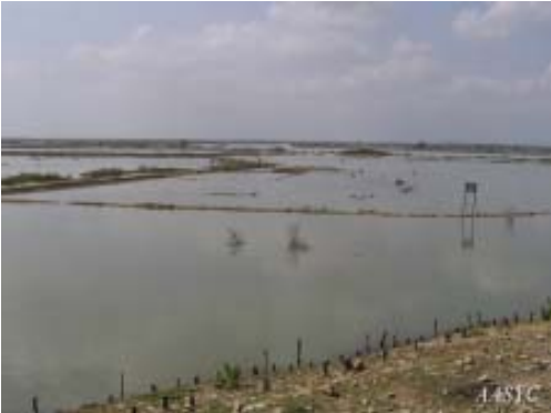
ရခိုင်ပြည်နယ်ရှိ စစ်တပ်နှင့် ဒေသလုပ်ငန်းရှင်များပိုင်သော ပုဇွန်မွေးမြူရေးလုပ်ငန်းများ

လမုတောနှင့် ကျေးရွာပိုင်သစ်တောများအပါအဝင် ဧရာမသစ်တောကွက်များကို စစ်တပ်က ၎င်းတို့၏ စီးပွားရေး လုပ်ငန်းများအတွက် အတင်းအဓမ္မ သိမ်းယူခဲ့သည်။ ကုလားတန်မြစ်ဝှမ်း၌ စစ်တပ်၏ ပုဇွန်မွေးမြူရေးလုပ်ငန်း နှင့် အခြားစီးပွားရေးလုပ်ငန်းများအတွက် လမုတောများ အကြီးအကျယ် ပြုန်းတီးသွားခဲ့သည်။