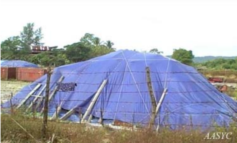
သံဆူးကြိုးများဖြင့် ကာရံထားသော သိမ်းပိုက်ခံမြေယာ

ယခုအခါ၌ သိမ်းယူထားပြီး လယ်မြေများကို သံဆူးကြိုးဖြင့် ဝင်းခတ်ကာရံထားပြီး ရွာသားများ အနီးအနား သို့မဟုတ် ရောက်နိုင်အောင် နယ်မြေရံတပ်ဖွဲ့အပါအဝင် အစောင့်တပ် တတပ်ဖြင့် တင်းတင်းကျပ်ကျပ် စောင့်ကြပ်ထားသည်။ ၈၅