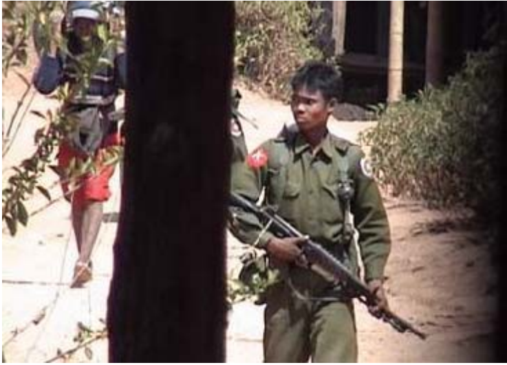
မြန်မာစစ်သားများက ပေါ်တာတစ်ဦးကို ပစ္စည်းများသယ်ခိုင်းနေပုံ ၄၉

(၂၀၀၈) ခုနှစ်၊ မေလတွင် နယ်မြေစစ်တပ်က ရခိုင်ပြည်နယ်၊ တိမ်ညိုကျေးရွာမှ ရွာသားများအား စစ်တွေ-ရန်ကုန် အဝေးပြေးလမ်းမကြီးပြင်ဆင်ရာ၌ အတင်းအဓမ္မအလုပ်စေခိုင်းခဲ့သည်။ ရွာသားများသည် အခကြေးငွေမရဘဲ အလုပ်လုပ်ပေးကြရသည်။ အကယ်၍ ပျက်ကွက်ပါက ဒဏ်ငွေကျပ် (၅,၀၀၀) (အမေရိကန်ဒေါ်လာ ၃.၇ ဒေါ်လာ) ရိုက်သည်။ ဒဏ်ငွေမပေးဆောင်နိုင်ပါက စစ်တပ်စခန်းထဲမှာ (၇) ရက် အချုပ်ခံရပြီး အလုပ်ကြမ်းနှင့် ထမင်းချက်အလုပ်များကို လုပ်ရသည်။ ၄၉