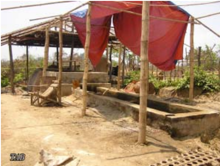
ရိုးရာရေနံချက်စက်ရုံ

တွင်းတူးရာမှ ထွက်လာသော ရွှံ့နွံများကို ချောင်းဝချောင်းထဲသို့ စီးဝင်ညစ်ညမ်းစေခဲ့ကာ ဒေသတွင်းရှိ ငါးမျိုးစိတ်များကို သေကြေပျက်စီးစေခဲ့သည်။ (၂၀၀၇) ခုနှစ်ဆန်းပိုင်း၌ တွင်းတူးရာမှာ အသုံးပြုခဲ့သောပစ္စည်းများ