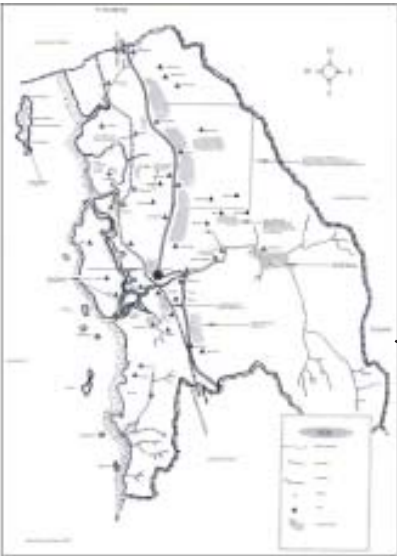
ရဲမြို့နယ်