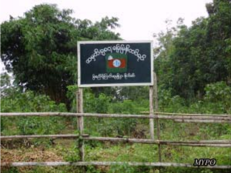
ရေးမြို့နယ်ရှိ (ခမရ) (၅၈၇)၏ ကြက်ဆူပင်စိုက်ခင်း