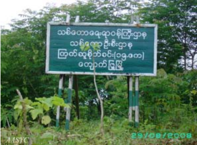
ကျောက်ဖြူမြို့ရှိ (၁၅)ဧကရှိသော ကြက်ဆူပင် စိုက်ခင်း

ထိုလအတွင်းမှာပင် အမှတ် (၉၆၂) စစ်အင်ဂျင်နီယာတပ်ဆွယ်က ထိုနယ်မြေ၌ လယ်မြေ (၃၅) ဧကကို သိမ်းယူပြီး အမှတ် (၈) စစ်မြေပြင် ဆေးတပ်ရင်းကလည်း စစ်တွေ-ရန်ကုန် အဝေးပြေးလမ်းပေါ်ရှိ ယိုးဝန်းနှင့် သရက်ချိုကျေးရွာအကြားမှ လယ်မြေ (၃၁.၅) ဧကကို သိမ်းခဲ့သည်။ နေရာတိုင်းမှာပင် လယ်သမားများအနေနှင့် မိမိတို့၏ အသိမ်းခံထားရသော လယ်ကိုပြန်လုပ်လိုပါက “စပါးတင်း (၆၀)” ပေးဆောင်ရမည်ဟု သတ်မှတ်သည်။ ၃၄