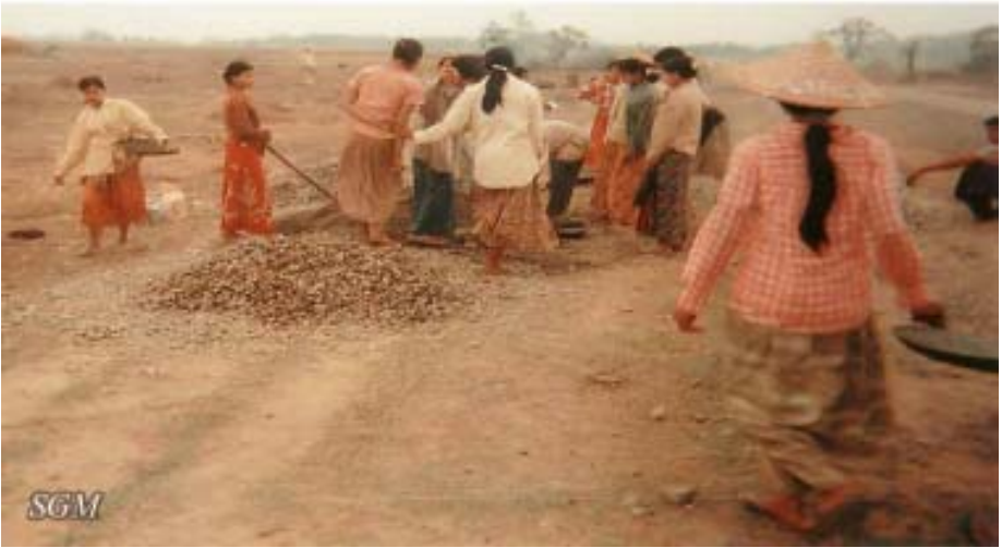
ရခိုင်ပြည်နယ်တွင် ရွာသားများအား လမ်းပြင်ရာ၌ အတင်းအဓမ္မအလုပ် စေခိုင်းခဲ့သည်။

(၂၀၀၇) ခုနှစ်၊ နိုဝင်ဘာလမှ (၂၀၀၈) ခုနှစ် ဇန်နဝါရီလ (၁) ရက်နေ့အထိ၊ ရှမ်းပြည်နယ်၊ ထောဒေးကျေးရွာမှ ရွာသားများကို မြန်မာစစ်တပ်က သီတင်းတပတ်လျှင် (၂) ကြိမ်၊ (၃) ကြိမ် ပေါ်တာလိုက်ခိုင်းနေရာ နောက်ဆုံး၌ ရွာရှိ အိမ်ထောင်စု (၁၆) စုအနက် (၉) စု ထွက်ပြေးသွားရတော့သည်။ ၄၇