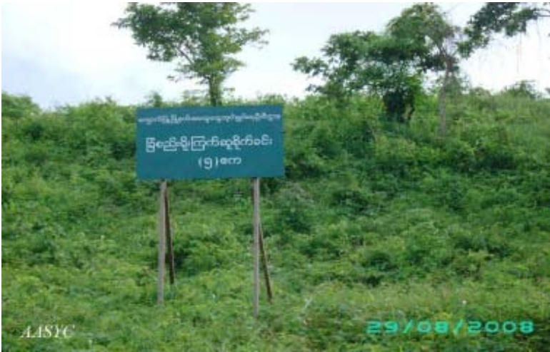
ကျောက်ဖြူမြို့နယ်အတွင်းရှိ (၅)ဧကရှိသော ကြက်ဆူပင်စိုက်ခင်း