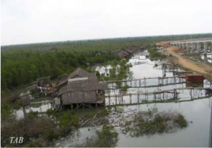
ကုလားတန်မြစ်၎င်းရှိ ခြိမ်းခြောက်ခံနေရသော သစ်တောများ

ထို့အပြင် သစ်တောများက ငါးမျိုးစိတ်များ၊ ငှက်များနှင့် ရခိုင် တောလိပ်များအတွက်လည်း ခိုလှုံရာနေရာ ဖြစ်သည်။ “ဤနေရာ၌ ခုလောလောဆယ်အချိန်အထိ ပုဇွန်မွှေးမြူရေးလုပ်ငန်းများနှင့် ထင်းခုတ်မှုများကြောင့် စတုရန်း ကီလို မီတာ (၆၀,၀၀၀) ခန့် သစ်တောပြုန်းတီးသွားခဲ့ပြီး ဖြစ်သည်။” ၆၅