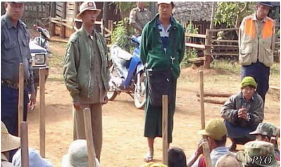
ဆီဆိုင်ရဲတပ်ဖွဲ့က သိမ်းထားသောလယ်ယာမြေများမှာ ပအိုဝ်းရွာသားများအား အလုပ်စေခိုင်းလျက်ရှိသည်။

(၂၀၀၇) ခုနှစ်၊ နိုဝင်ဘာလမှ (၂၀၀၈) ခုနှစ် ဇန်နဝါရီလ (၁) ရက်နေ့အထိ၊ ရှမ်းပြည်နယ်၊ ထောဒေးကျေးရွာမှ ရွာသားများကို မြန်မာစစ်တပ်က သီတင်းတပတ်လျှင် (၂) ကြိမ်၊ (၃) ကြိမ် ပေါ်တာလိုက်ခိုင်းနေရာ နောက်ဆုံး၌ ရွာရှိ အိမ်ထောင်စု (၁၆) စုအနက် (၉) စု ထွက်ပြေးသွားရတော့သည်။ ၄၇