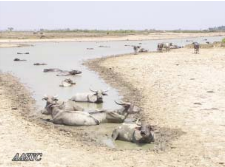
စားစရာစားကျက် မရှိသော ရခိုင်ပြည်နယ်မှ ကျွဲနွားများ