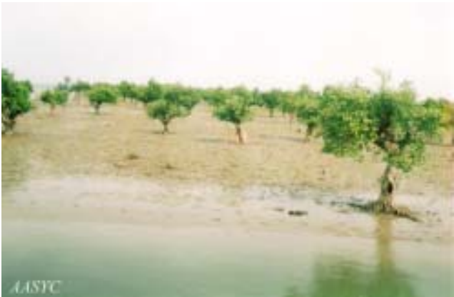
ရခိုင်ပြည်နယ် ကုလားတန်မြစ်ကြောင်းတလျှောက်ရှိ ဒြမ်းခြောက်ခံနေရသော ဒီရေရောက်တောများ

ဤသစ်တောများက ကမ်းခြေကို ဒီလှိုင်းများ၊ မြေဆီလွှာ တိုက်စားမှုနှင့် မုန်တိုင်းကဲ့သို့သော သဘာဝဘေးရန်များ ၏ ဒဏ်တို့မှ ကာကွယ်ပေးပါသည်။