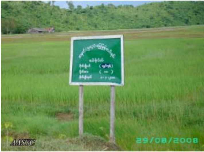
ကျောက်ဖြူမြို့နယ်၊ လယ်ကေ (၁၀၀)ကို (ခမရ) (၅၄၃) က (၂၀၀၈) ခုနှစ်၊ ဇူလိုင်လ (၇) ရက်နေ့တွင် သိမ်းယူခဲ့သည်။