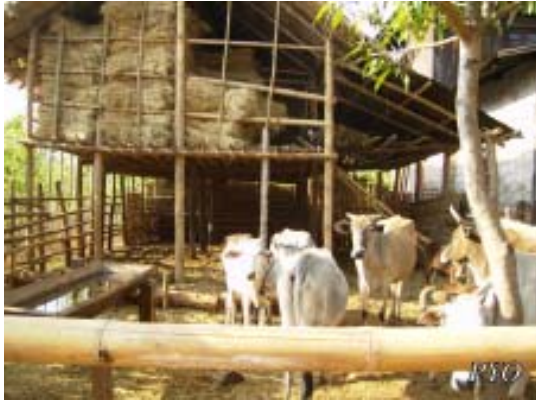
လယ်သမားများသည် မိမိတို့၏ စားကျက်မြေများ အသိမ်းခံရပြီးနောက်ပိုင်းတွင် ကျွဲနွားများကို လှောင်ခြံများထဲမှာ လှောင်ထားကြရသည်။

ပေးရတယ်။ စစ်တပ်တွေ ကျနော်တို့နယ်ထဲကို ရောက်လာပြီးတဲ့နောက် သူတို့စစ်တန်းလျားတွေ ဆောက် ပေးရမယ့်ကိစ္စဟာ ကျနော်တို့အဖို့ ရောမ ဒုက္ခကြီးပါပဲဗျာ။” ၆၀ ဟု ရွာသားတစ်ဦးက ဆိုသည်။