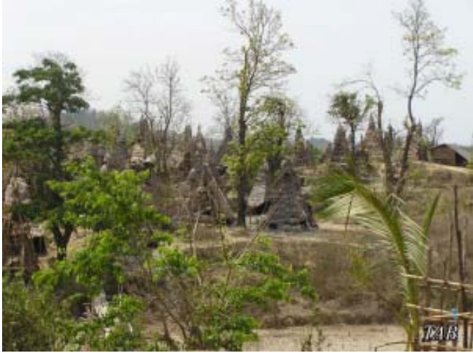
ရိုးရာရေနံတွင်းများ

အနေနှင့် သူ့အလုပ်သမားများအတွက် ပေးစရာရှိသည်များကို မိမိအိတ်ထဲမှငွေဖြင့် စိုက်ပေးခဲ့ရပြီး သူ့မှာ လုပ်ငန်းအကြီးအကျယ်ထိခိုက်ခဲ့ရသည်။