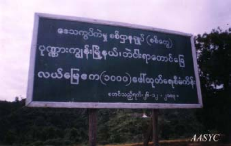
မြေဧက (၁၀၀၀)ကျော်သိမ်းယူကြောင်း အသေးစိတ်ဖော်ပြချက်

ကုလားတန်မြစ် အနောက်ဘက်ကမ်းရှိ အဝေးပြေးလမ်းမကြီးတလျှောက် ပန်းနီလာနှင့် ကျင်ခင်ကျေးရွာ အကြား နှင့် ပုဏ္ဏားကျွန်းမြို့နယ်အတွင်းရှိ မြေဧက (၁, ၀၀၀) ကို စစ်တွေ စစ်ဌာနချုပ် အမှတ် (၂၀) က ထပ်မံ၍ သိမ်းပြန်သည်။ ၃၁