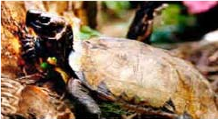
ခြိမ်းခြောက်ခံနေရသော ရခိုင်တောလိပ်များ

(၁၉၉၀) ခုလွန်နှစ်များ၌ ရခိုင်ပြည်နယ်၊ မြေပုံမြို့နယ်ရှိ ဒေသခံကျေးရွာများပိုင်သော ကွန်းချောင်းတောင်တန်း တွင်သစ်များကို အလုအယက် ခုတ်ခဲ့ကြသည်။ သစ်တောများထဲမှ ကျွန်းနှင့် အခြားသစ်မာများ အပါအဝင် သစ်မှန်သမျှကို ခုတ်ပြီး အိန္ဒိယနှင့် ဘင်္ဂလားဒေ့ရှ်နိုင်ငံများသို့ ရောင်းချခဲ့သည်။ ဤလုပ်ငန်းတွင် နယ်ခံလူထု များကို အလုပ်သမားအဖြစ် ငှားရမ်းခဲ့သော်လည်း လုပ်ငန်းကို ချုပ်ကိုင်များမှာကား နယ်မြေအာဏာပိုင်များ၊ နယ်ခံစီးပွားရေးလုပ်ငန်းရှင်များနှင့် ထောက်လှမ်းရေးအရာရှိများ ဖြစ်သည်။ သစ်တောမှနေ၍ အမြတ်အစွန်းများ ရခဲ့ကြသော်လည်း တာဝန်ရှိသူများက ခုတ်လှဲခဲ့သော သစ်တောများနေရာတွင် အစားထိုး ပြန်စိုက်ပေးခြင်း