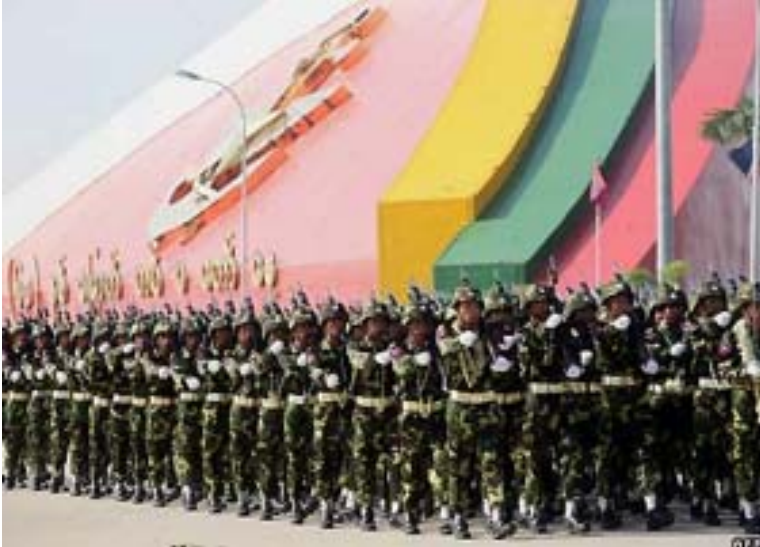
(၂၀၀၈) ခုနှစ် မတ်လ (၂၇) ရက်၊ တပ်မတော်နေ့တွင် မြန်မာစစ်တပ် စစ်ရေးပြနေပုံ ၁၀

“တပ်မတော်”ဟုလည်း အများသိထားကြသော (နအဖ) စစ်အစိုးရ၏ စစ်တပ်မှာ အင်အား (၄၉၀, ၀၀၀) ခန့်ရှိသည်။ (၁၉၈၉) ခုနှစ် မှစ၍ နှစ်ဆကျော်ကျော်အထိ တိုးလာခဲ့ခြင်းဖြစ်သည်။ ၇ ထို့ပြင် မြန်မာနိုင်ငံရှိ ရဲတပ်ဖွဲ့မှာလည်း အရန်ရဲအင်အား (၄, ၅၀၀) အပါအဝင် အင်အား (၇၂, ၀၀၀) ခန့်ရှိသည်။ ၈ ပြည်ပရန်သူဟူ၍ မရှိသော်လည်း အကြမ်းဖျင်းအားဖြင့် လူဦးရေ (၁၀၀) လျှင် စစ်သား (၁) ယောက်နှုန်းခန့် ဖြစ်နေသည်။ မြန်မာနိုင်ငံတွင် ပြည်ပမှ အထူးသဖြင့် တရုတ်၊ ထိုင်းနှင့် ရုရှားနိုင်ငံတို့မှ လက်နက်ရောင်းချမှုနှင့် ရင်းနှီးမြှုပ်နှံမှုများ တိုးမြှင့်ခြင်းမရှိပါက စစ်တပ်တိုးချဲ့ရေးကိစ္စသည် ဖြစ်နိုင်မည် မဟုတ်ချေ။ ၉