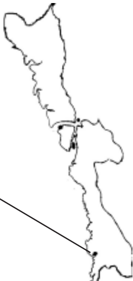
မွန်ပြည်နယ်မြေပုံ